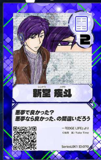
いぬ4 Fake Time