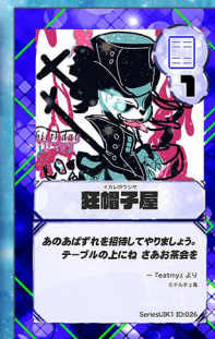
ペガサス14 ドルチェ毒