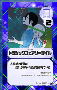
へガサス10 911人の森を焼かれたゴリラ