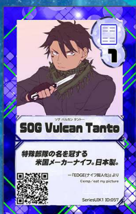
ぞう3 ツナ缶ごはん