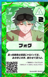
いぬ19 むしむしプラネット