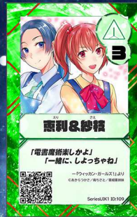
へガサス1 垂細垂姉妹