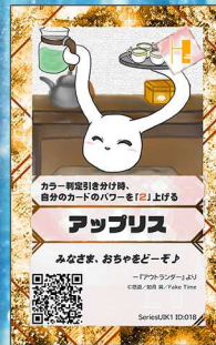
いぬ4 Fake Time