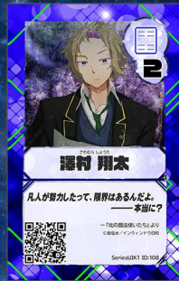
ぞう5 インウィンドウ日和