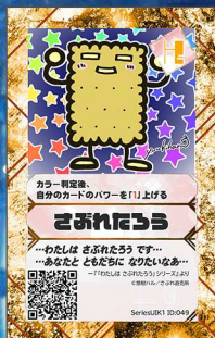
とり7 さぶれ直売所