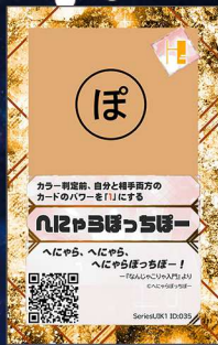
ねこ4 へにやらぼっちぽー