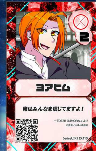
へガサス7 ふゆふゆ劇場