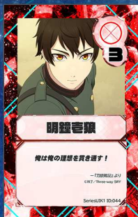
とり9/10 Three-way SRY