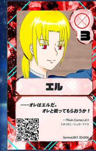
いぬ2 シュガーアイス