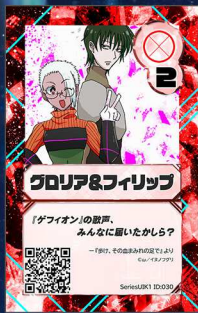
いぬ1 イヌノフグリ