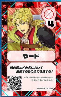
いぬ18 ☆人-スターヒューマン-