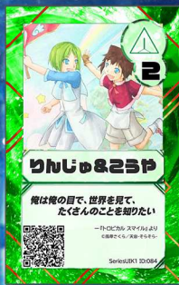
とり21 宇宙-そらそら-