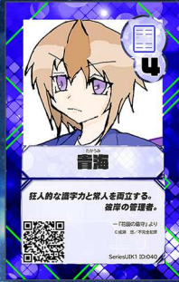
へガサス9 不完全犯罪