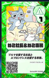
企業2 (有)ねこのしっぽ