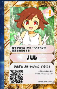
とり9/10 Three-way SRY