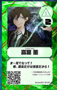
ぞう5 インウィンドウ日和