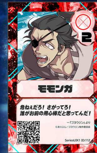
とり20 ゴウジン制作委員会