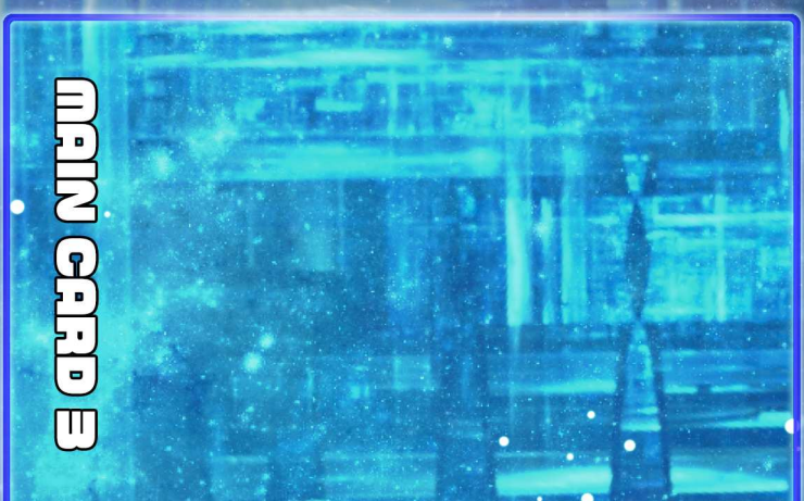
MAIN CARD 3