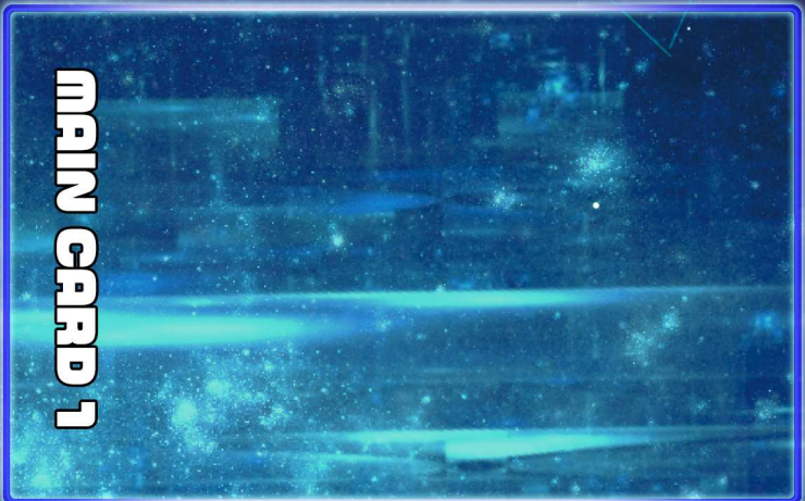
MAIN CARD 1