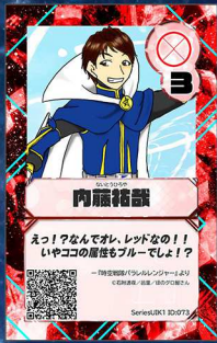
ぞう18 ほのグロ屋さん