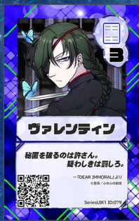
ペガサス7 ふゆふゆ劇場