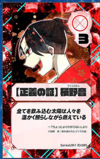
ペガサス10 911人の森を焼かれたゴリラ