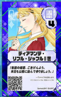
ねこ15 王女シャッフル