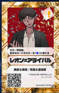
いぬ1 イヌノフグリ