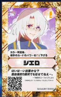
いぬ19 むしむしプラネット