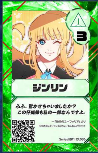
いぬ19 むしむしプラネット