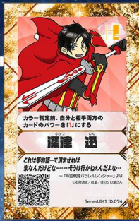
ぞう18 ほのグロ屋さん