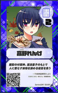
ペガサス1 垂細亜姉妹