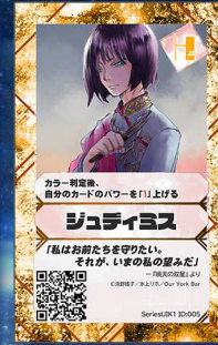
ねこ11/12 Our York Bar