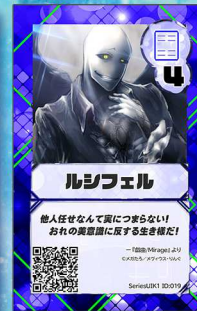
ぞう2 メグイウス-りんぐ