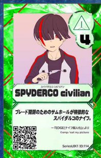
ぞう3 ツナ缶ごはん