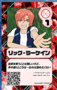
いぬ4 Fake Time