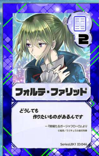
とり15 ラブチュラス夜行列車