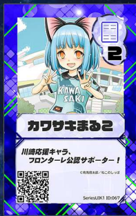
企業2 (有)ねこのしっぽ