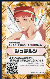
いぬ19 むしむしプラネット