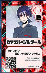
ぞう19 朝焼けが来る前に