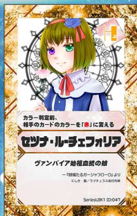
とり15 ラブチュラス夜行列車