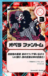
ペガサス14 ドルチェ毒