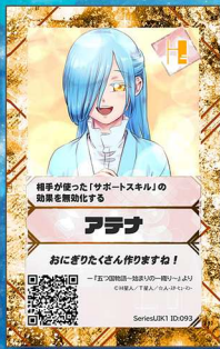
いぬ18 ☆人-スターヒューマン-