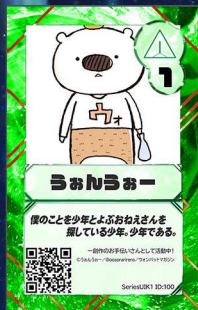
運営事務局 うちカフ主催