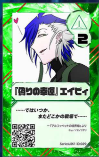
いぬ1 イヌノフグリ