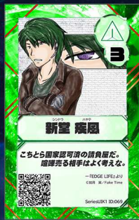
いぬ4 Fake Time