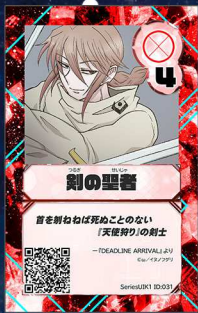
いぬ1 イヌノフグリ