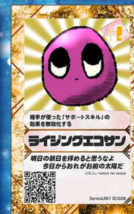
ぞう9 notice me senpai