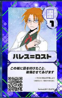
ぞう19 朝焼けが来る前に