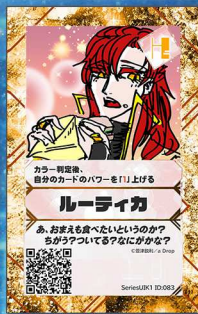
ねこ17 a Drop