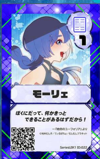
いぬ19 むしむしプラネット