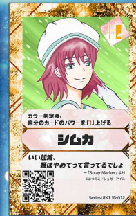
いぬ2 シュガーアイス