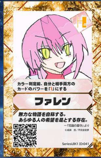
へガサス9 不完全犯罪