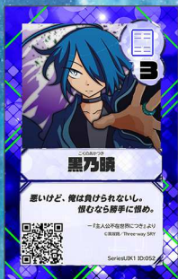
とり9/10 Three-way SRY