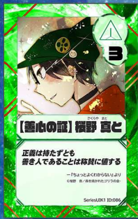
ペガサス10 911人の森を焼かれたゴリラ