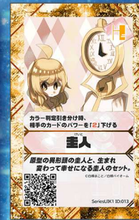
ぞう1 白禅バイオーム