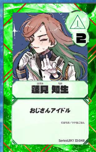
ぞう3 ツナ缶ごはん