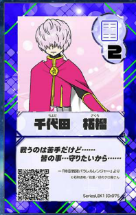
ぞう18 ほのグロ屋さん