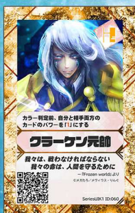
ぞう2 メヴィウス=りんぐ