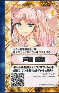
ペガサス1 垂細亜姉妹