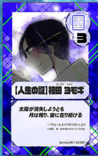
ペガサス10 911人の森を焼かれたゴリラ