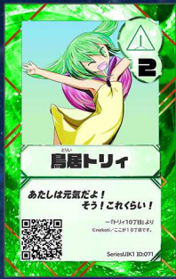
いぬ7 ここが10丁目です。