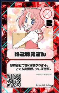
企業2 (有)ねこのしっぽ