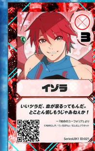
いぬ19 むしむしプラネット